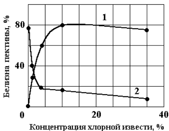
Рис. 1. Зависимость параметра белизны (1) и относительного содержания остаточных пектинов (2) в льняной вате от концентрации хлорной извести. Время химобработки (без ЭР-обработки) 60 мин, температура раствора 60–80 0 С.